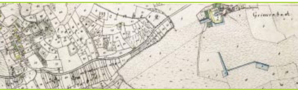
Stöckelberg und Weinberg zwischen Mettenbach und Griebenbach (Uraufnahme aus dem Jahr 1812)

Heute deuten auf die traditionelle Nutzung nur noch Flurnamen wie „Weinberg“, „Weingarten“, „Zwetschgenlage“ oder „Nussental“ hin (s. Uraufnahme). Die steilen, trockenen und kiesigen Hänge können heute nicht mehr rentabel bewirtschaftet werden, so dass sie zunehmend verbrachen und mit Gehölzen zuwachsen. In flacheren Bereichen wiederum fanden Nutzungsintensivierungen oder Aufforstungen statt, kleine Flurstücke wurden zur besseren Bewirtschaftbarkeit zusammengelegt. Die über Jahrhunderte gewachsene Kulturlandschaft mit ihren vielfältigen Lebensräumen und seltenen Tier- und Pflanzenarten geht Stück um Stück verloren. Im Rahmen des BayernNetz Natur-Projekts „Isarleiten im Landkreis Landshut“ wird dieser Entwicklung aktiv entgegen gewirkt.